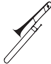
POSAUNE in C 1 Mikrofon