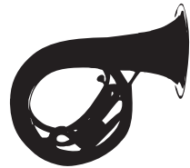
BASS 1 Mikrofon