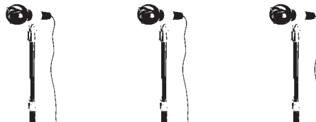
GESANG + MODERATOR 3 Mikrofone