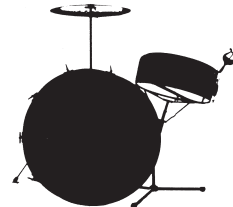
SCHLAGZEUG 3 (2) Mikrofone