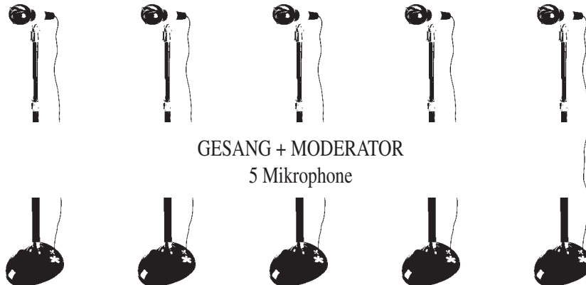
GESANG + MODERATOR 5 Mikrofone