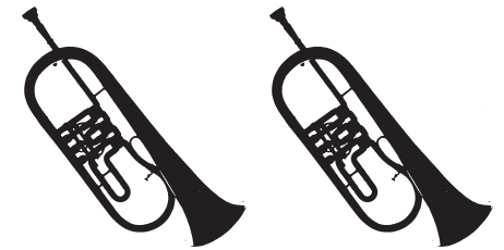
2.FLÜGELHORN in B 1.FLÜGELHORN in B 1 Mikrofon 1 Mikrofon } oder 1 Mikrofon