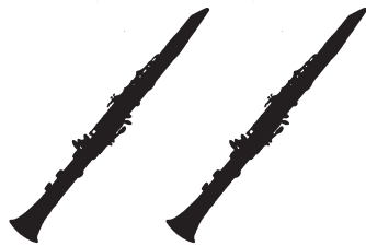
KLARINETTE in Es KLARINETTE in B 1 Mikrofon 1 Mikrofon } oder 1 Mikrofon