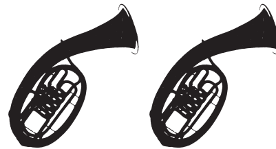
BARITON TENORHORN 1 Mikrofon 1 Mikrofon } oder 1 Mikrofon