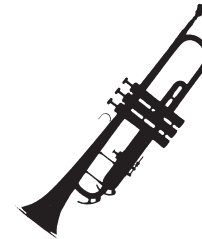
1.TROMBA in B 1 Mikrofon